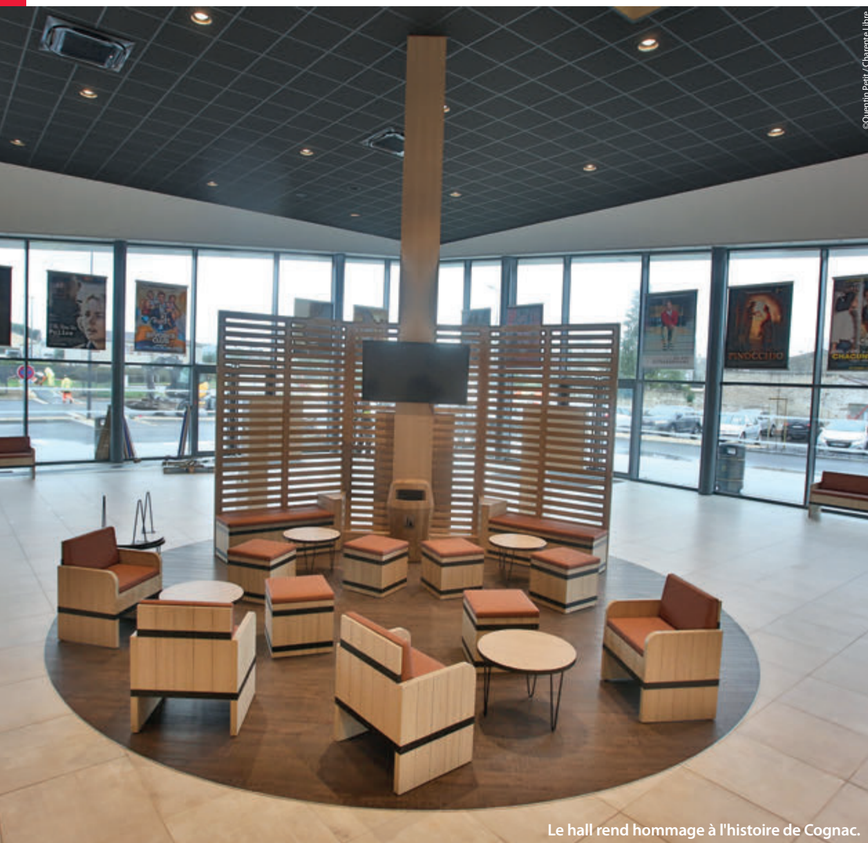
Le hall rend hommage à l'histoire de Cognac.