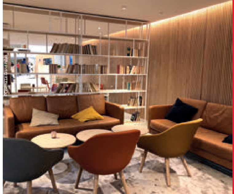
Le Bistrot propose une carte de produits locaux et un espace bibliothèque.

C'est une affaire d'histoire : à l'heure où L'Ascension de Skywalker vient clore la sienne, celle du Grand Palais n'en est qu'aux prémices. Un récit dont les bases sont ancrées dans un contexte bien précis. Nous sommes le 18 décembre. L'automne touche à sa fin à Cahors, préfecture et commune du Lot. En cœur de ville, les habitants trépignent devant une grande bâtisse en briques claires sur laquelle scintille l'enseigne « Grand Palais ». L'ouverture du nouveau cinéma n'est qu'une question d'heures. Sous ce manteau designé par l'architecte Antonio Virga, novice en matière de cinéma, sept salles ont été agencées sur deux niveaux : deux au rez-de-chaussée et cinq à l'étage. Elles varient de 69 à 320 places pour une capacité globale de 1 054 fauteuils. Projection 100 % laser, 4K, son 7.1 et même du Dolby Atmos dans l'une des grandes salles, reconnaissable par le gris de ses sièges, quand les autres salles arborent un bleu nuit. Les couloirs épurés et mélangeant tons blanc et bleu font le lien avec un vaste hall d'accueil très lumineux, avec un comptoir billetterie en bois. Sur la droite, un bistrot a été agencé dans une ambiance cosy avec tables basses et bibliothèques.