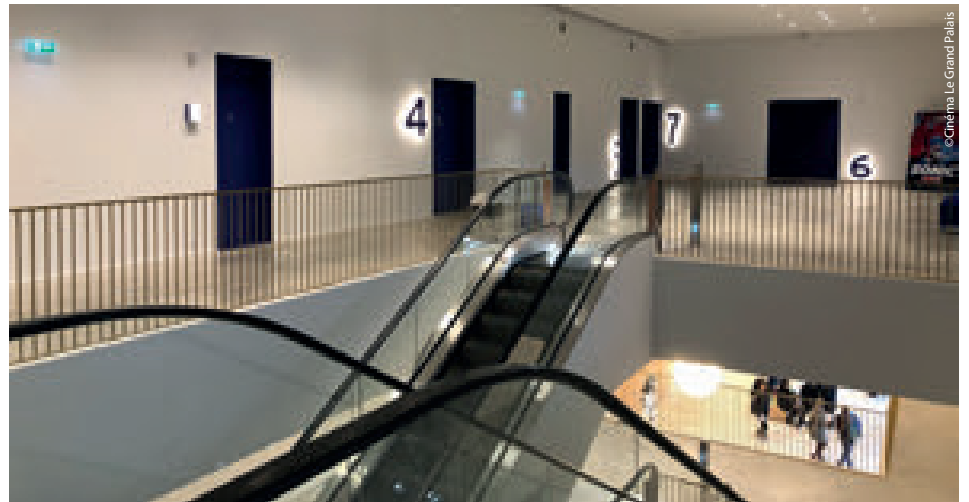
L'étage abrite cinq des sept salles du cinéma.