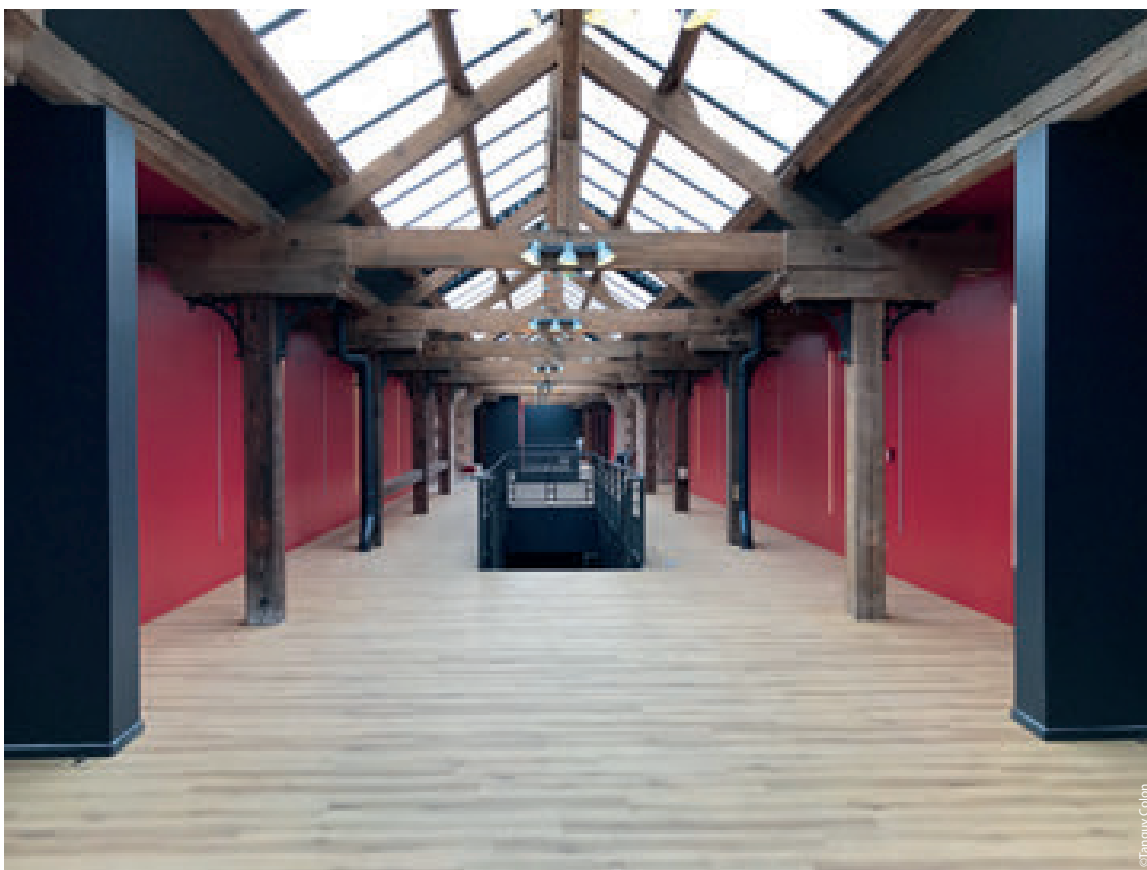
Le couloir menant aux salles est abrité par une verrière.