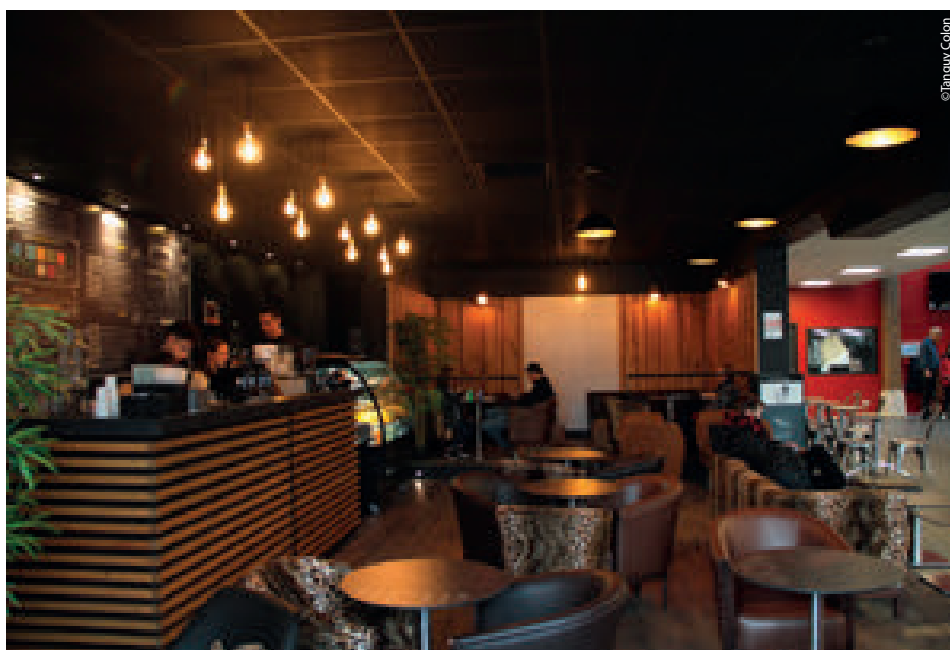
Le French Coffee Shop.