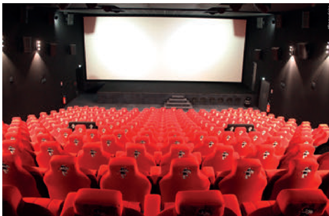
La salle Thomas Pesquet se différencie grâce au petit astronaute apposé au dos des fauteuils.

Le Grand Forum de la commune de l'Eure va s'agrandir. Les travaux d'extension ont démarré fin octobre sur un terrain annexe au cinéma, racheté en juin par l'exploitant à la ville. Cette sixième salle sera dotée de 350 places et équipée d'un écran de 16 mètres de base, d'un projecteur 4K et du son DTS-X. Le coût est estimé à 1,4 million d'euros, dont 400 000 euros sont versés par la ville via la Loi Sueur. L'ouverture est attendue pour l'été prochain. Pour rappel, Jean-Edouard Criquioche a racheté au printemps les salles 1 à 4 à la municipalité, qui conservera, à l'issue des travaux de la sixième, la salle 5, partagée actuellement entre le cinéma, la ville et la scène nationale. À noter que l'an passé, le Grand Forum de Louviers avait réalisé environ 120 000 entrées.