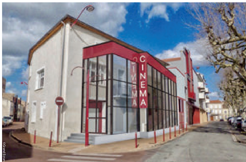
Le cinéma de 4 écrans de Villeneuve-sur-Lot va ouvrir début décembre 2 salles supplémentaires.