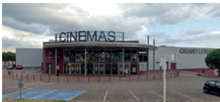
Le Grand Écran Ester de Limoges va porter sa capacité de 12 à 14 écrans.