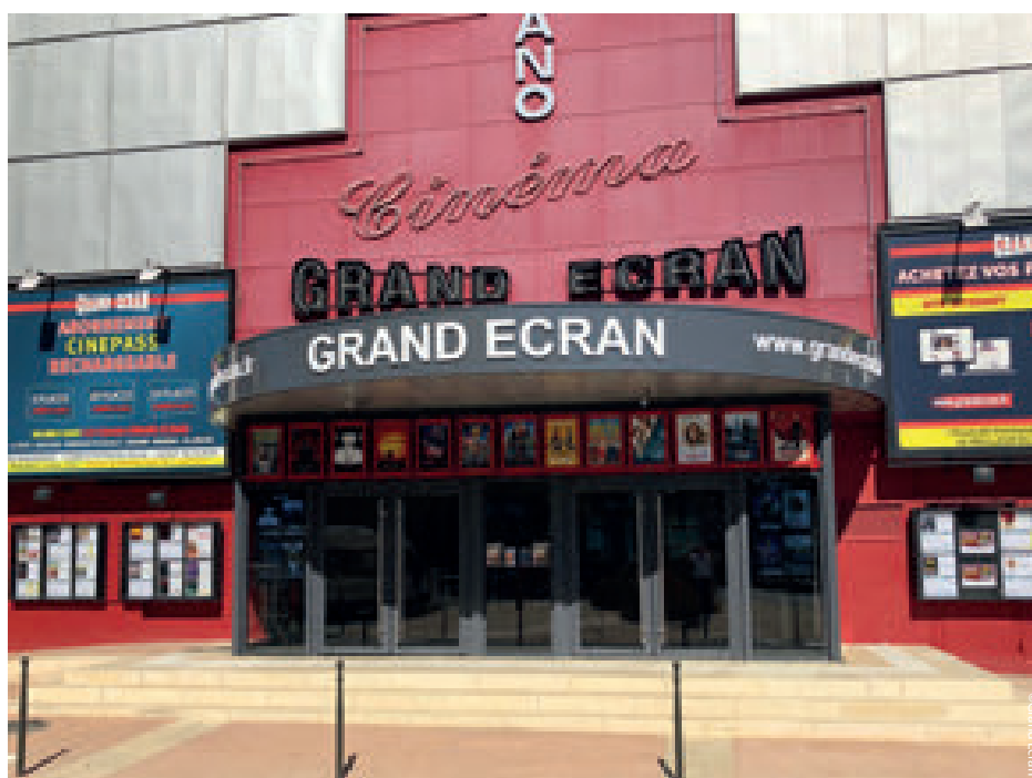
Le Grand Écran de Bergerac est doté d'un hall plus spacieux depuis cet été.

L'ouverture du cinéma de Langon s'accompagne d'une série de projets que Grand Écran mène sur plusieurs fronts. Depuis un an et demi, le groupe a lancé un vaste programme de modernisation du site de Bergerac. La plus grande des neuf salles a été intégralement rénovée l'an passé, offrant un meilleur confort au public. Cet été, le hall a connu un lifting avec une extension et l'ajout d'un auvent, le rendant plus spacieux. L'ensemble des travaux devrait s'achever d'ici 2 à 3 ans et permettre à l'établissement, qui attirait 170 000 personnes, de dépasser les 200 000 entrées annuelles. Plus à l'est, la famille Fridemann poursuit l'agrandissement du cinéma de Villeneuve-sur-Lot, acquis en 2013. Une première salle avait été ajoutée aux trois existantes en 2015 et l'acquisition d'un bâtiment mitoyen va permettre d'ouvrir le 4 décembre prochain deux écrans supplémentaires, dotant au passage le site du label Cinémax. Malgré la proximité d'Agen et de son multiplexe, Grand Écran espère, avec cette extension, passer de 84 886 entrées en 2018 à plus de 150 000.