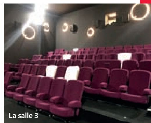
La salle 3