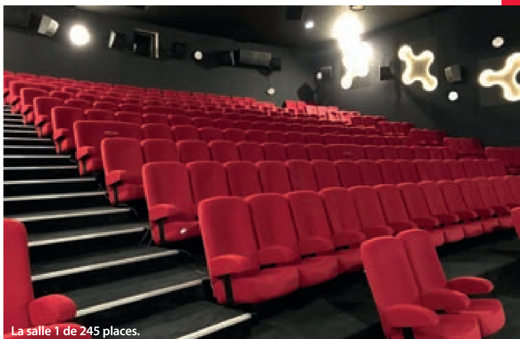
La salle 1 de 245 places.