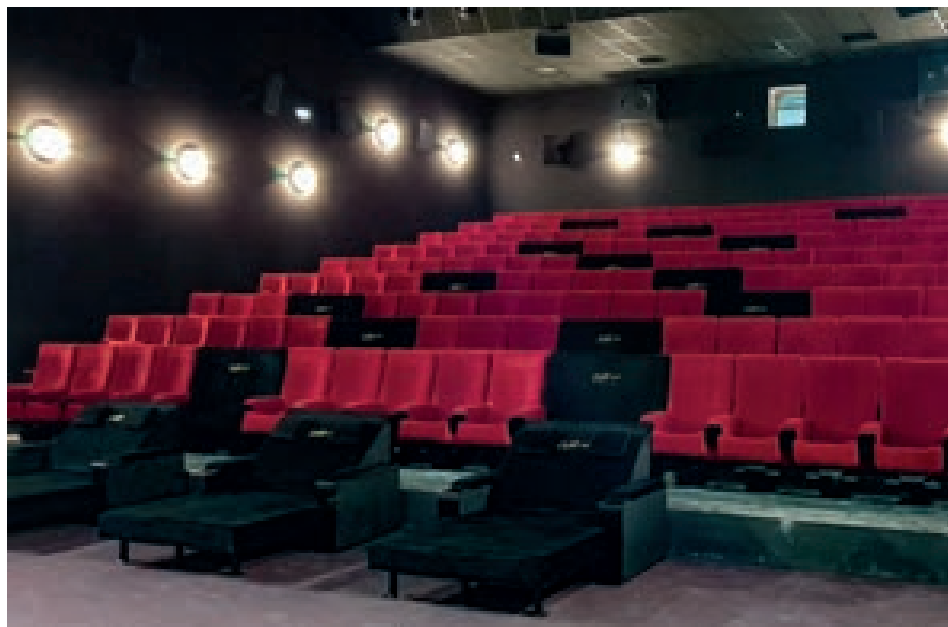
Salle 1, avec projection Laser 4K, son Dolby Atmos... et pour la petite touche pratique pour les changements d'ampoules, de l'éclairage uniquement sur les murs.

C'est dire que le cinéma peut compter sur la clientèle hors saison et les 180 associations de la 2 e ville du département qui comptabilise officiellement 14 000 habitants, « auxquels il faut ajouter 8 000 personnes non inscrites à l'INSEE qui occupent leur résidence secondaire à l'année », et qui dépasse