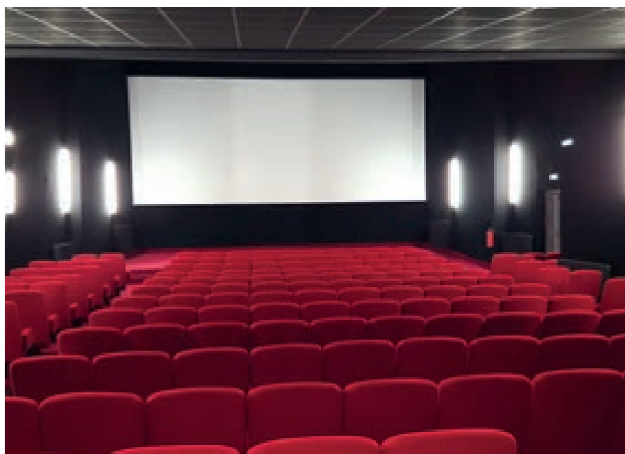
... et rénovée.