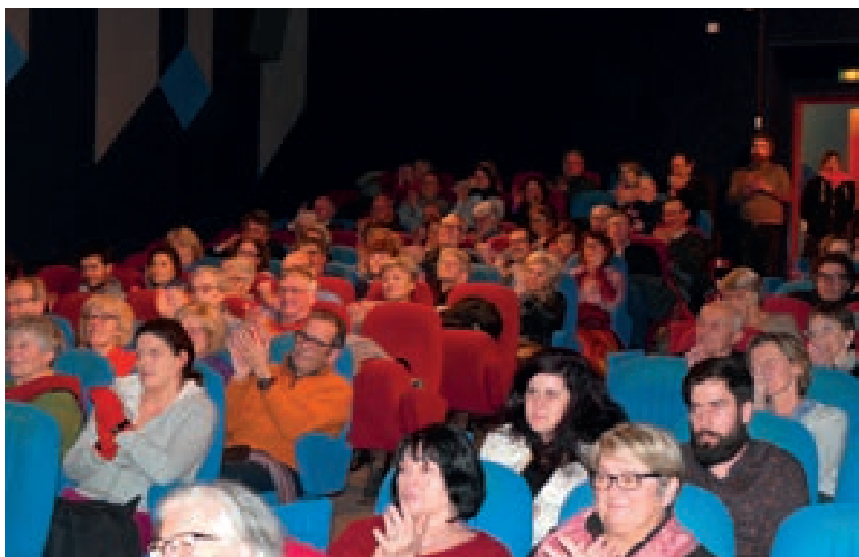
La salle du Cristal le soir de l'inauguration