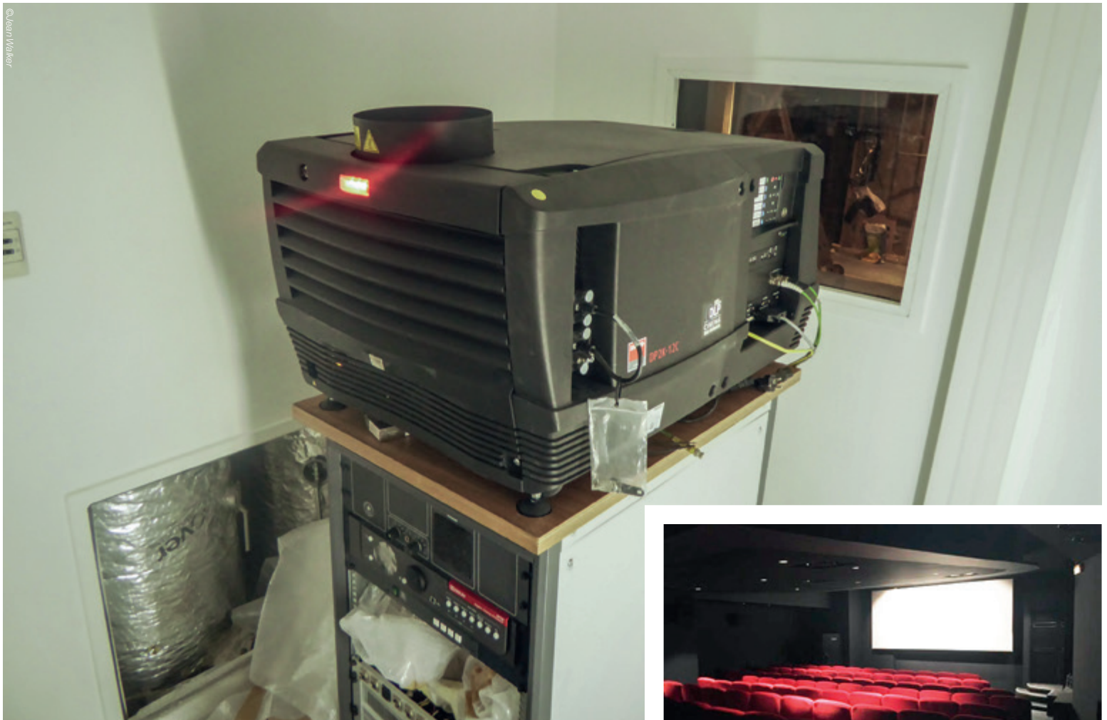
La mini-cabine des 3 Lux