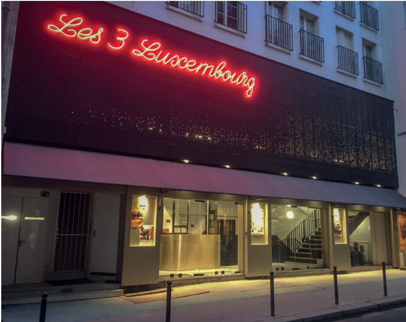
La nouvelle façade