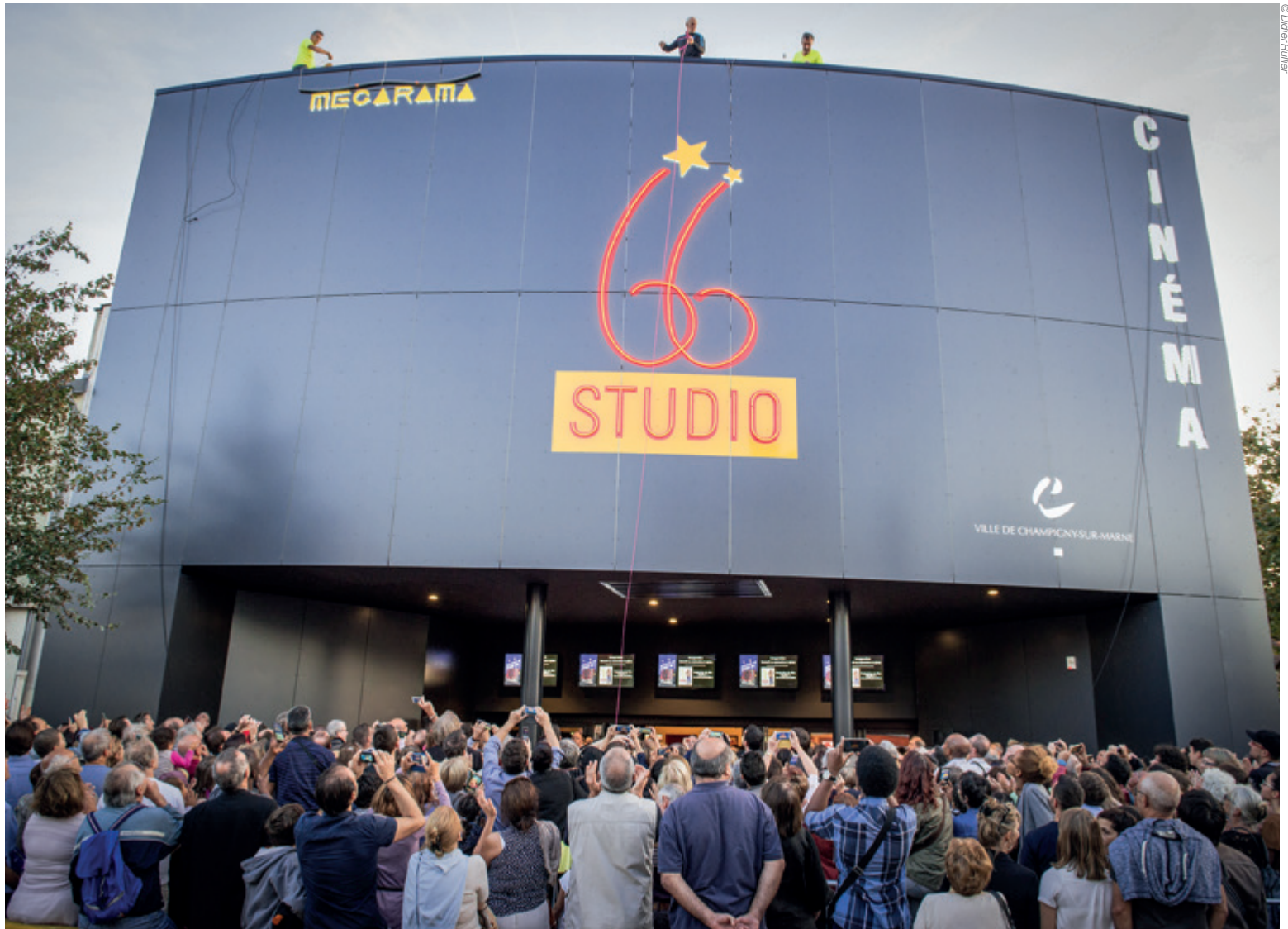
L'inauguration du Studio66

Après un an de fermeture pour travaux, le Studio 66 de Champigny, affilié au groupe Mégarama, a ré-ouvert il y a deux mois totalement rénové, avec une programmation généraliste et Art & essai.