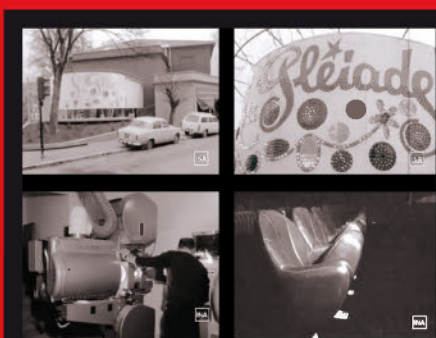
Le cinéma en 1970 photos INA.