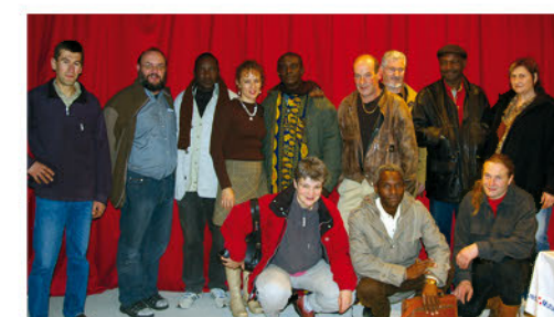
Une animation autour du film Bamako .

mation culturelle qui permettrait au public de découvrir des expositions sur le cinéma, de participer à des débats de fond sur un film à l'affiche, d'accueillir des concerts, des ateliers de formation à l'image pour les enfants et les plus grands...et peut être même des avant-premières ! Les travaux étant bien avancés, grâce aux subventions communales et départementales, l'ouverture de la salle devrait se faire cette année. Si Emmanuel Ménétrier se félicite de cette nouvelle carte à jouer, il a tout de même un regret : « Autrefois, le public se déplaçait plus pour voir un acteur que pour le film en lui-même. Un titre avec Belmondo, Delon ou Louis de Funès attirait forcément le spectateur. Aujourd'hui, cette époque est révolue, et je trouve cela dommage ». Mais il ne