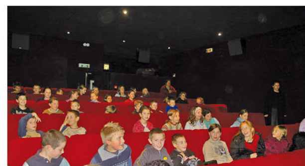
Le public scolaire.