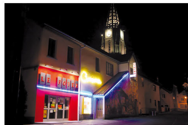
Le Foyer de nuit.