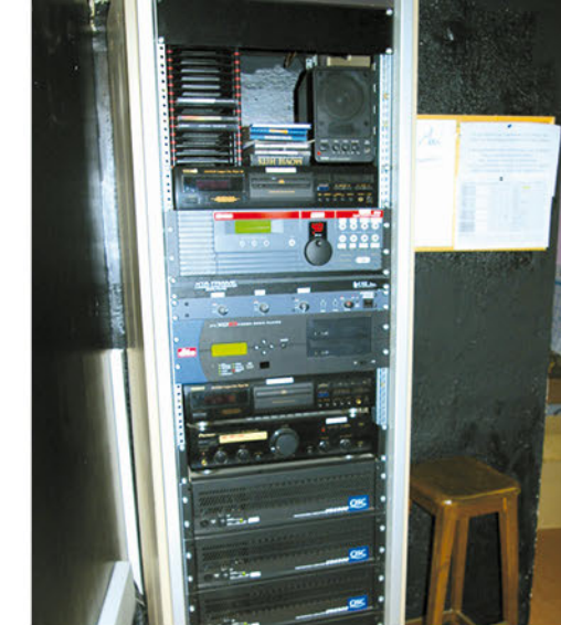
Le rack son.

s'inquiète pas pour autant de l'avenir du Foyer de Pont de Roide. L'association et les bénévoles sauront faire perdurer ce cinéma, comme ils le font depuis maintenant 73 ans.