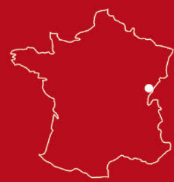
Pont de Roide dans le Doubs