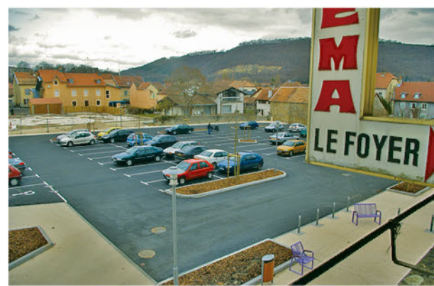
Le tout nouveau parking.