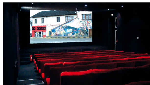
La façade dans la salle.