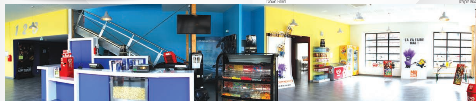
Le hall d'entrée