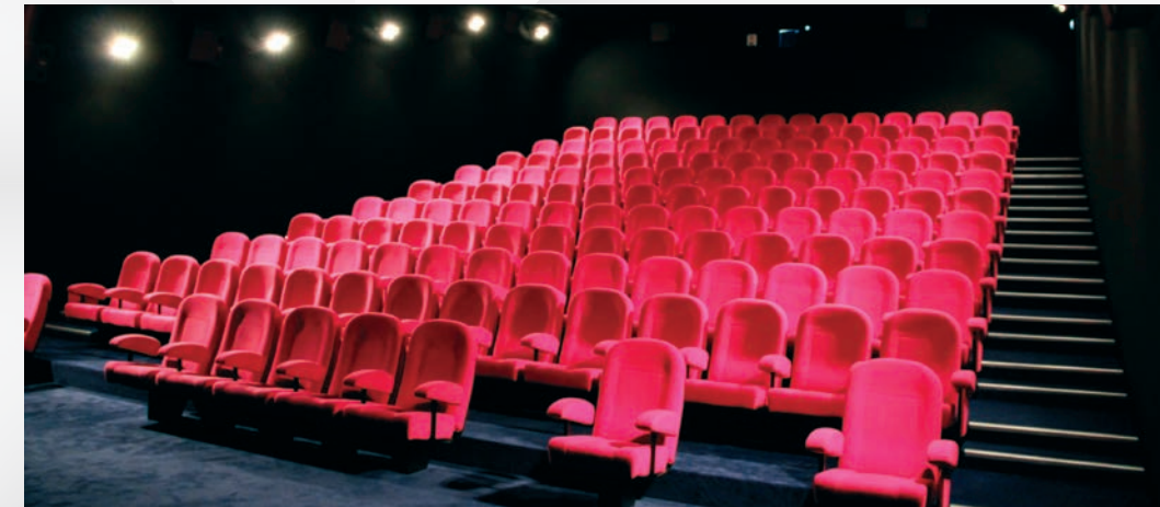
La salle 2